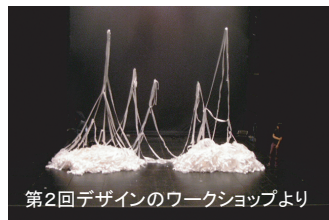
第2回デザインのワークショップより