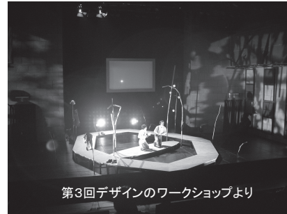
第3回デザインのワークショップより

このワークショップを通じて、それぞれの中に秘められている豊かな発想力・想像力・構想力を発見し将来の糧としてもらいたいと思います。