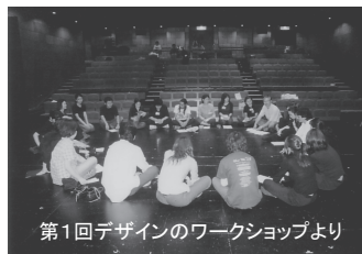
第1回デザインのワークショップより